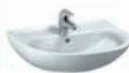
Umivalnik PRO 55x44 66,5€