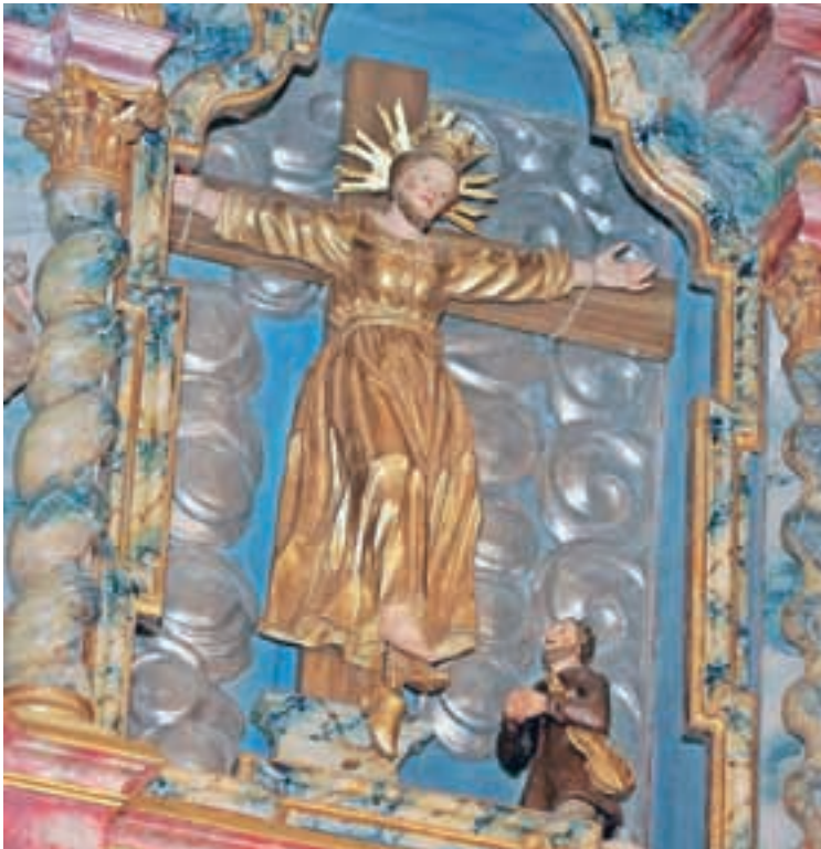
Sv. Kuma poseblja hči bogate gosposke, ki je zavračala poroko z izbranim ženinom, ker se je zaobljubila Kristusu.