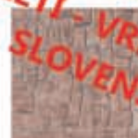
Protidrnsni granitogres NUSK 33.3x33.3 12,20€