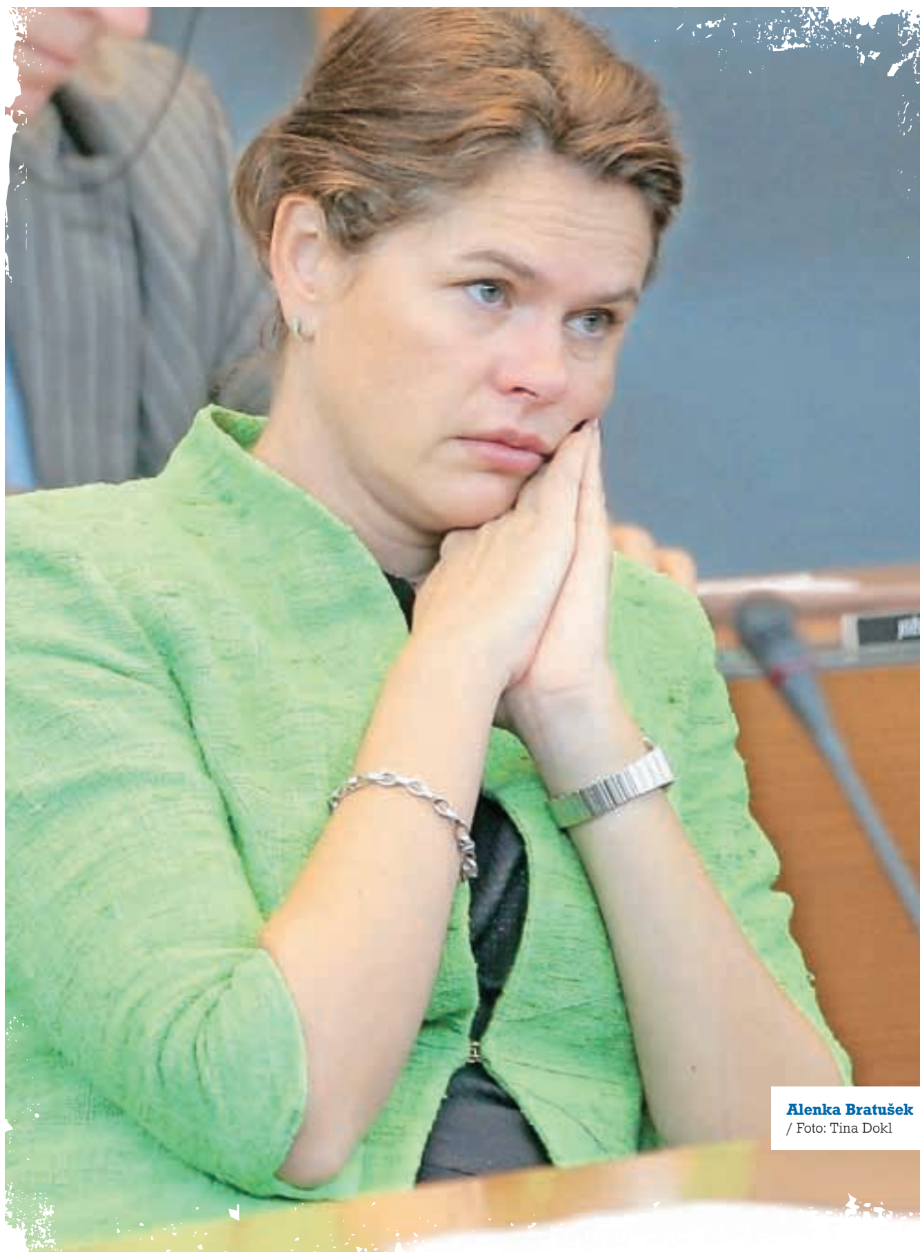
Alenka Bratušek