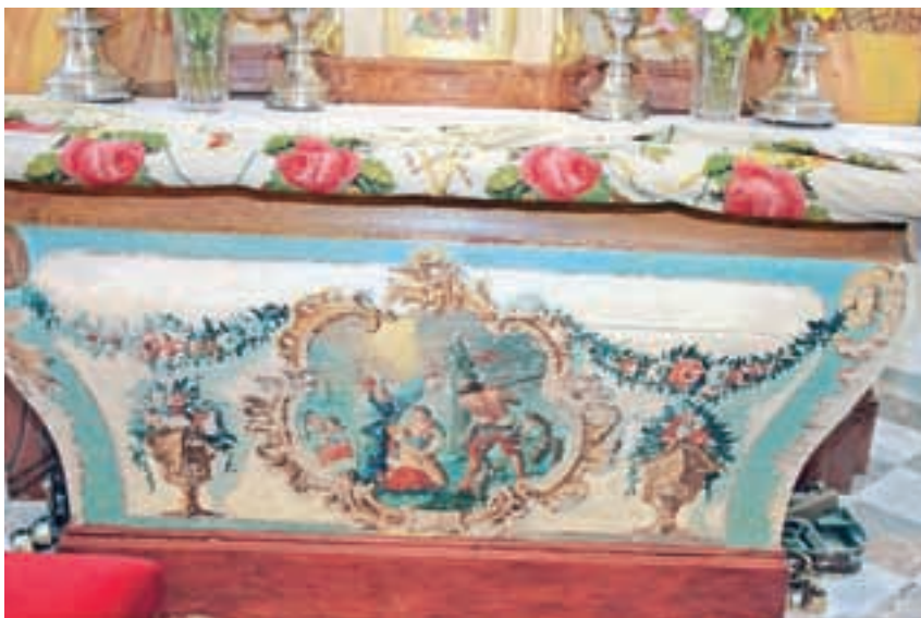
Baročni motiv na glavnem oltarju. »Gre za prvotno poslikavo te mize, lahko da bi jo poslikali v Layerjevi delavnici, ampak so bili njihovi kasnejši posnemovalci,« je pojasnil Fras.