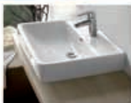
Napuljni umivalnik PRO 55x48 105€

PROIZVODNJA, INŽENIRING, TRGOVINA D.O.O. Šuceva 23, 4000 Kranj www.dolnov.si TEL: 04 201 30 00 dolnov@dolnov.si