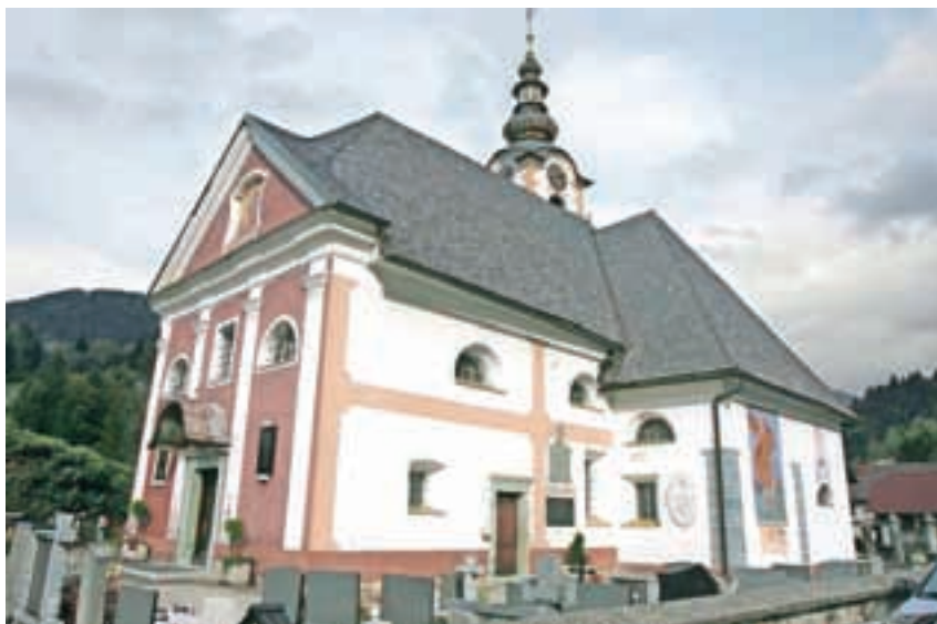
Cerkev sv. Katarine v Lomu pod Storžičem

Cerkev sv. Katarine ima več oltarjev, še posebej pritegne Marijin oltar, ki so ga blagoslovili pred nedavnim po zaključku restavratskih del. »Nekaj posebnega je arhitektura Marijinega oltarja, tega še nisem kaj dosti zasledil