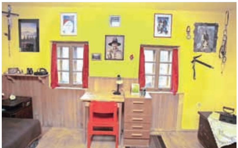
Domačija Filipa Benceta, svetovno znanega alpinista in gorskega reševalca, ki se je smrtno ponesrečil 3. aprila leta 2009. Na fotografiji je njegova soba, takšna, kot je bila, ko je v njej še živel.