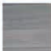
Elegantni Travertin granitogres 33x33 9,00€