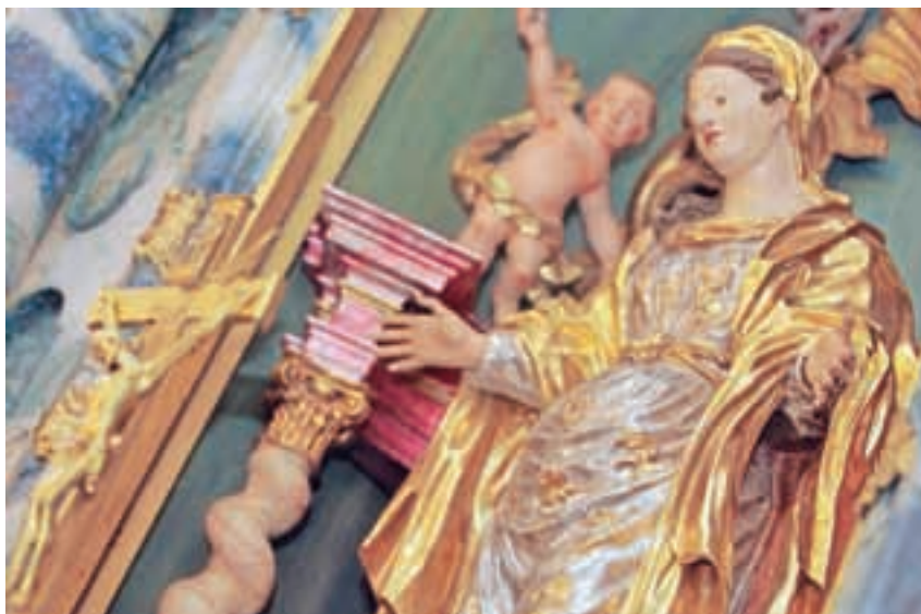
Edinstven kip Marije v blagoslovljenem stanju