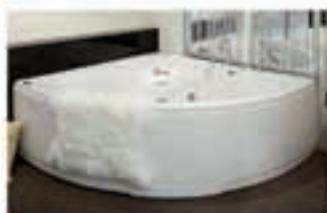
(oglašena kupovina!) A7- 2012 (100 funkcij) 150x150x63 1504€